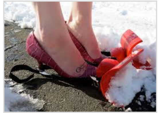
Řešení pro zimní dny

Žena smaží volské oko, když v tom momentě do kuchyně vtrhne muž a začne křičet: „POZOR!!! POZOR!!! VÍC OLEJE!!! POTŘEBUJEME VÍC OLEJE!!! POZOR!!! OTOČIT, OTOČIT, OTOČIT... RYCHLE!!! POZOR!!! ZBLÁZNILA SES??? TEN OLEJ!!! PROBOHA, SŮL!!! NEZAPOMEŇ NA SŮL!!!“ Žena už to nevydrží a úplně vynervovaná se ptá: „Co tak řveš?!? Myslíš si, že neumím udělat volské oko?“ Muž klidným hlasem odpoví: „To jen abys měla představu, jaké to je, když mi kecáš do řízení.“