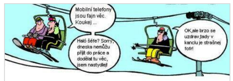
A přece se točí...